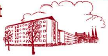
Exempel på 2-rumslägenhet

– ett boende med speciell profil i Uppsala