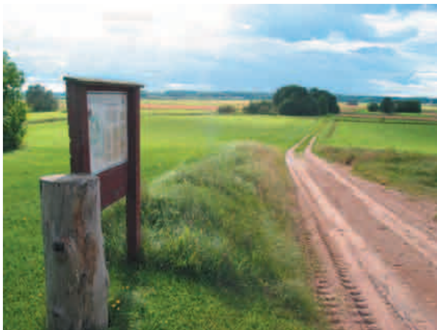
Snart ska man kunna vandra över Nötmyran och även korsa Svartån på en nyrustad kyrkbro.

Svartådalens Bygdeutveckling har erhållit Lokala Naturvårdspengar för att utveckla Naturleder i området. Den första etappen av projektet gäller cykel- och vandringsleder.