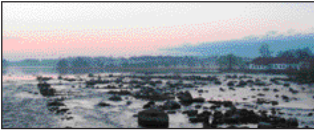
Leaderkontoret ligger i Gysinge, alldeles intill Dalälven.