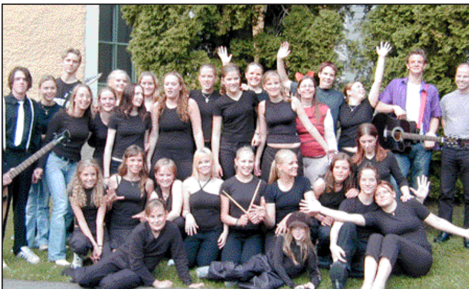
Kyrkans musik- & ungdomsprojekt "Med musiken som verktyg" har engagerat ett 60-tal ungdomar i bygden. Tillsammans har de flesta av dem repeterat in en föreställning på temat Disneys sagofigurer, som framfördes tre gånger på en och samma dag i juni. Givetvis blev det succé. Nu planerar man redan för en uppföljare.