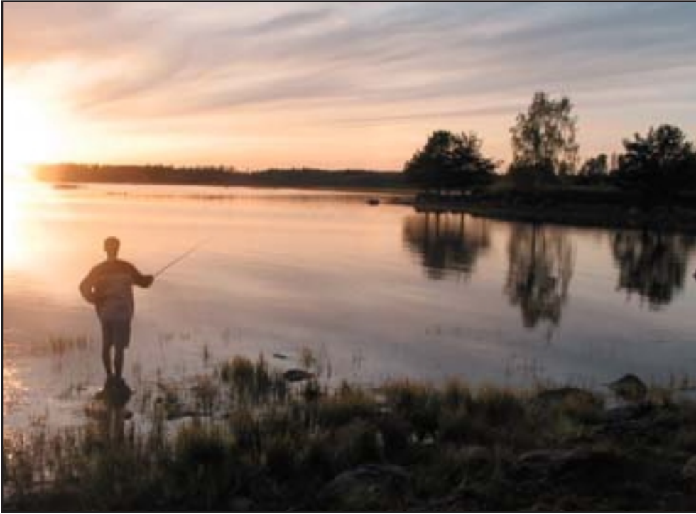
Att hjälpa markägare att gemensamt satsa på återinförel av flodkräftor i större skala i Svartåns sjöar och vatten är syftet med projektet "Svartåkräftan". Delmål är bl.a. att bilda fiskevårdsområden, starta lokal uppfödning och utveckla aktiviteter kring kräftor o kräftfiske.